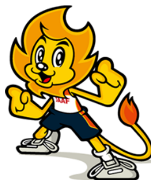
日本陸連公式マスコットキャラクター“アスリオン”